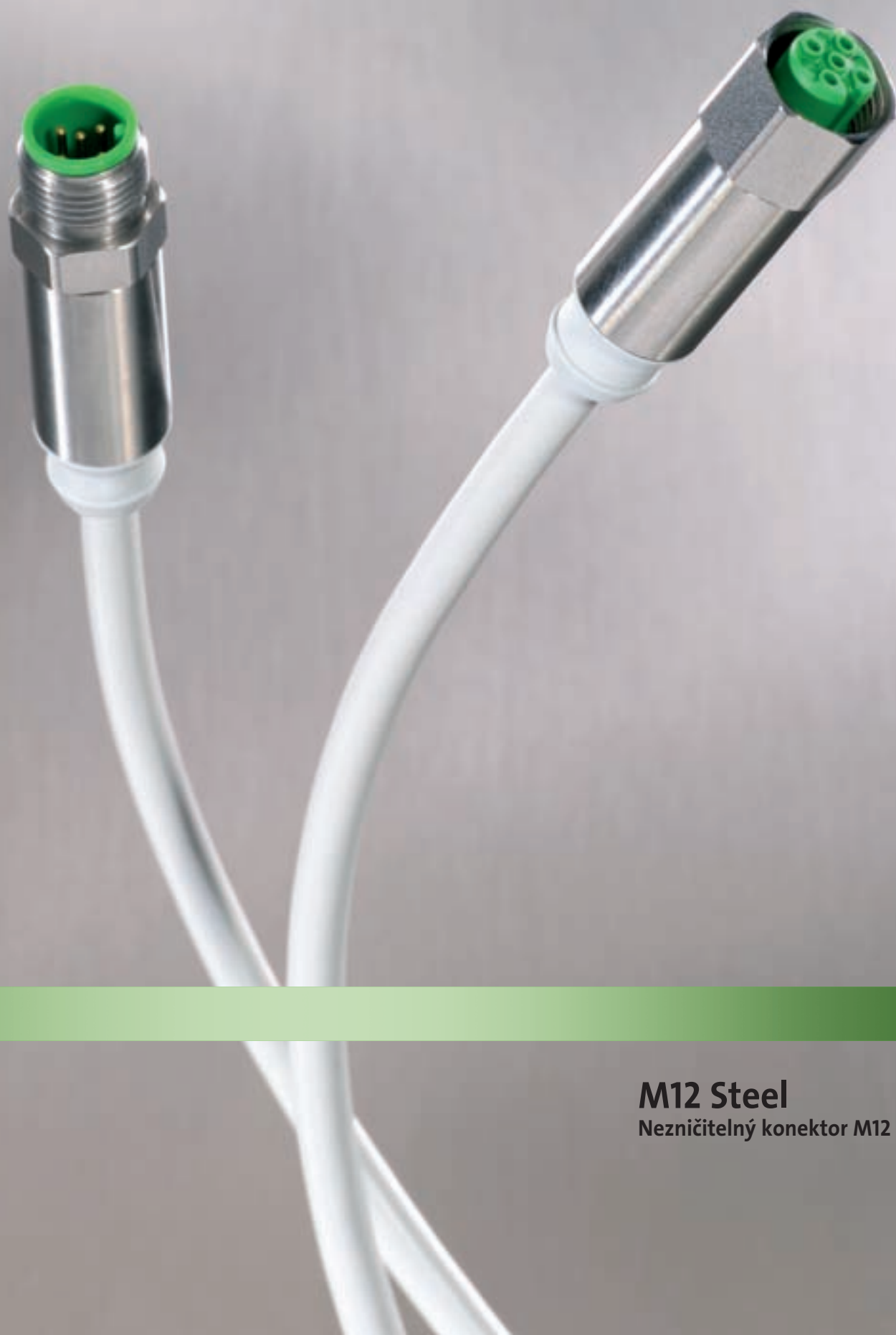
M12 Steel Nezničitelný konektor M12